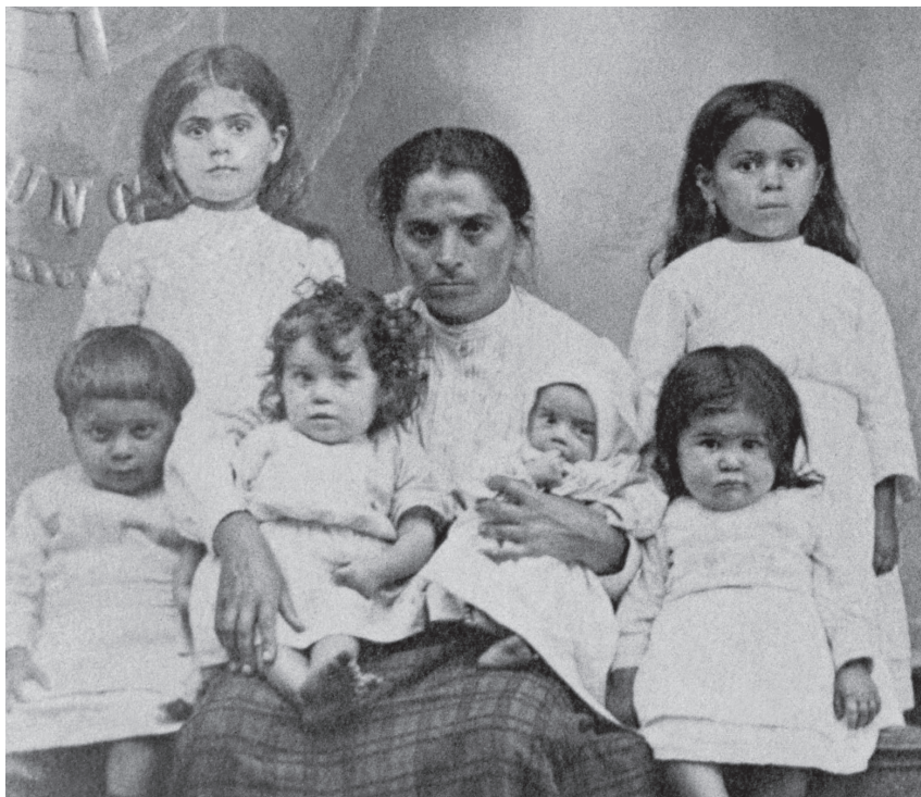
Imigrantes portugueses — foto de passaporte